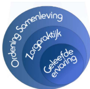
Figuur 1 11

Een zorgethische analyse bevat drie belangrijke perspectieven op goede zorg: de geleefde ervaring, relationele zorgpraktijken en de ordening van de samenleving (Leget, Van Nistelrooij & Visse, 2017) (figuur 1). De discussie in dit hoofdstuk speelt zich dan ook op deze drie niveaus af.